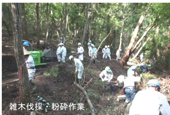
雑木伐採・粉碎作業

ため池の周辺にあつては、今後憩いの空間を創出すべく遊歩道を整備し、11月6日（日）には山桜・カエデの植栽を行います。