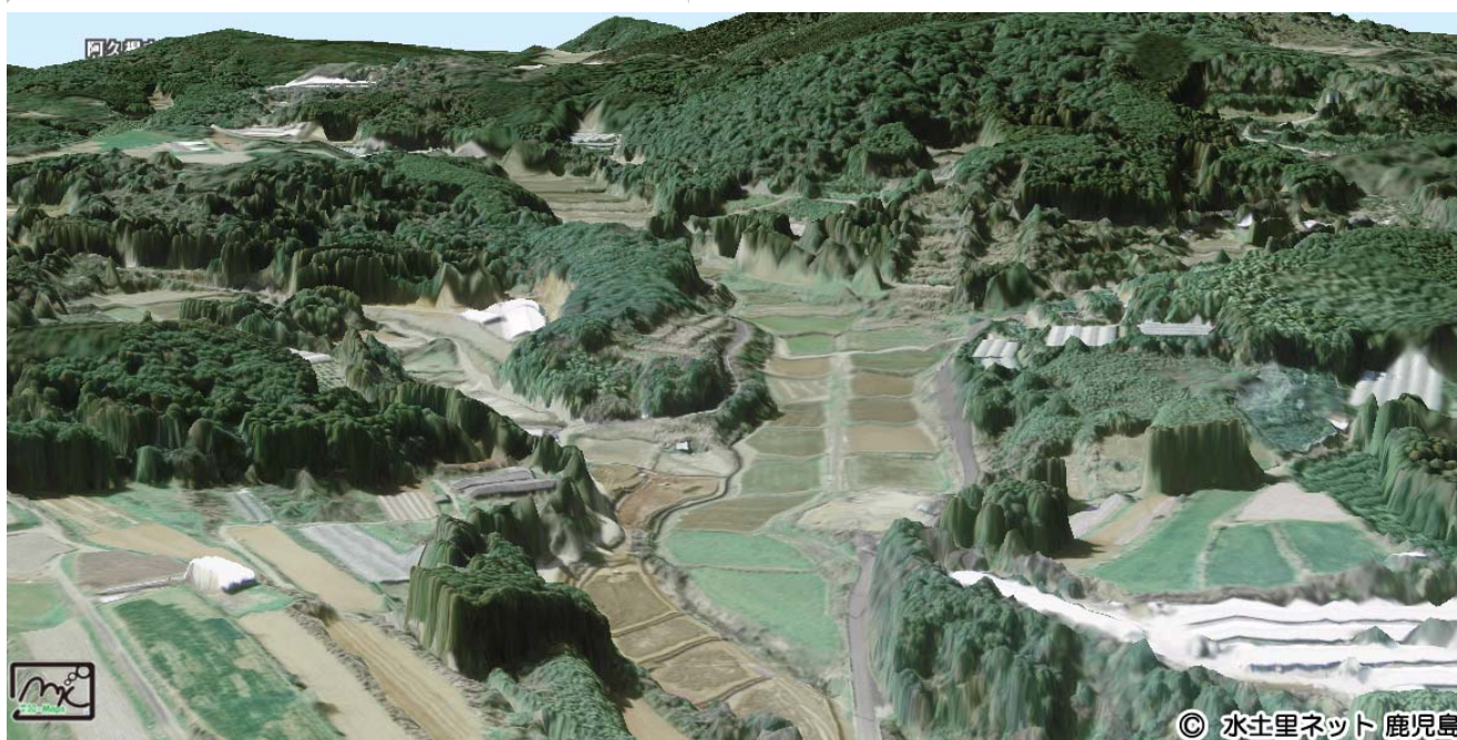
数値表層モデル(DSM)を用いた3次元地図