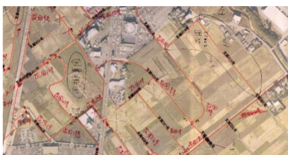
土地改良区へ位置情報の確認を行った図面