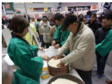
棚田米のすくい取りをする来場者

島根県では、県内11の棚田組織(うち、7つの棚田が「日本の棚田百選」に選定)、県、関係市町及び本会が構成メンバーとなり「しまねの棚田ネットワーク」が組織され、各地域で棚田の保全活動や交流活動が積極的に行われていますが、その一環として今回のフェアに、西田(太田市)、佐津目(同)、羽須美(邑南町)、山王寺(雲南市)の4組織が参加して各地域の魅力を情報発信するとともに、棚田米のすくい取りをしてもらい来場者をもてなしました。来場者の中には毎年棚田米を目当てに来られる方も多く、その人気の高さを伺い知ることができました。