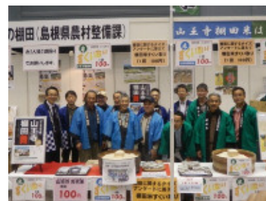
島根ふるさとフェアに参加された山王寺、羽須美の皆さん=広島県立総合体育館(19日)

このフェアは、島根県の隣接県で県外観光客入り込み数のトップを占める広島県において、島根県内各地域の魅力や観光資源等を紹介し、島根県と広島県の一層の交流促進を図ることを目的として開催されているもので、17回目の開催となった今年は、県内19市町村から参加した企業や各種団体が多数のブースを設け、各地域の特産品の販売やスタンプリナー、また、メインステージでは、各地域のお国自慢PRとして神楽や太鼓、踊りなどが披露されました。