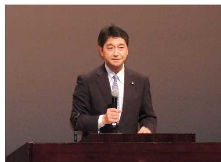
基調講演：進藤金日子参議院議員