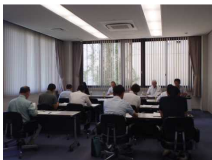
事業説明会の様子

7月13日(木)、本会会議室において平成29年度土地改良施設維持管理適正化事業新規加入地区及び実施地区説明会を開催しました。本事業は土地改良施設の定期的整備補修を行うもので、施設管理者の管理意識の昂揚を図るとともに、施設の機能保持と耐用年数の確保に資するものです。今年度は6団体から9名の出席があり、本事業の事業制度及び諸手続きについて説明を行いました。特に、今年度より農業水利施設への転落事故防止の安全施設(フェンス等)を整備する「安全管理施設整備対策事業」が追加されましたので、事業実施に向けてご検討ください。