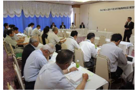
隠岐管内業務説明会の様子

最後に、意見交換会があり、参加者から中山間地域における各事業の実施要件の緩和や農地中間管理事業に関する意見や要望が出されるなど盛会裏に終了しました。